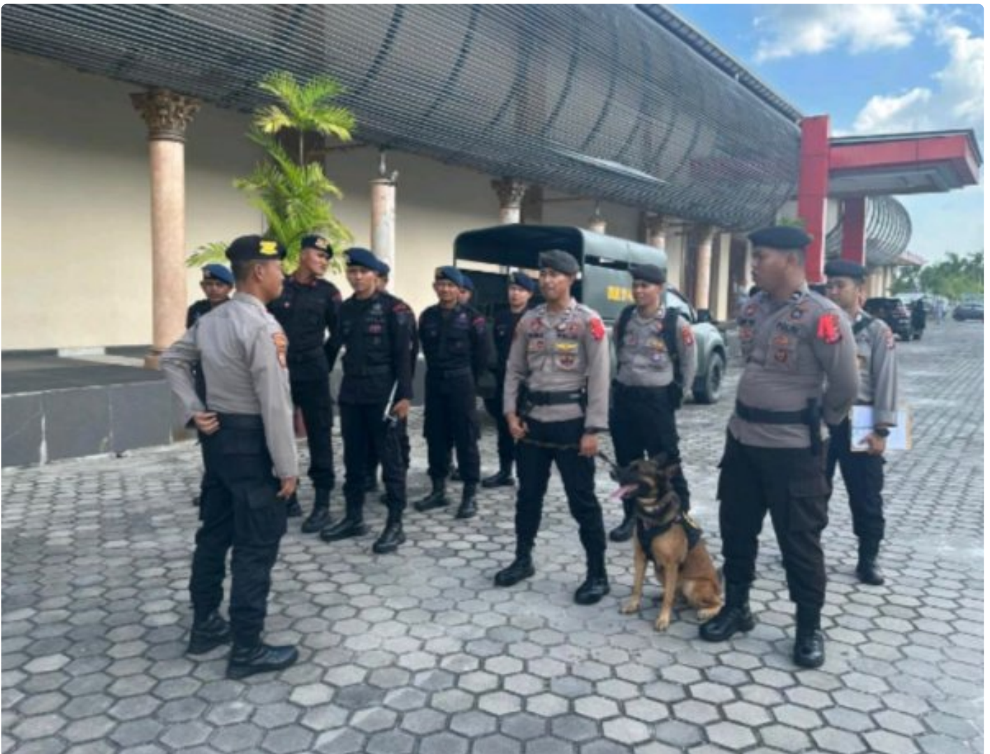
Satgas OMP Telabang Polda Kalteng

PALANGKA RAYAI - Polda Kaltengmenerjukkan personil yang tergabung dalam satuan tugas Operasi Mantap Praja (OMP) Telabang 2024, guna melakukan sterilisasi lokasi debat pasangan calon Bupati dan Wakil Bupati Kapuas yang digelar di Aula Kalawa Waterpark, Jl. Tjilik Riwut Km. 6, Kota Palangka Raya. Sabtu (26/10/24) sore.